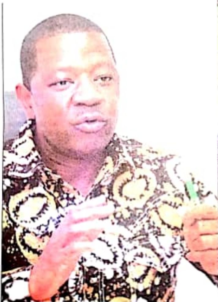
NAIBU Waziri wa Mifugo na Uvuvi, Abdallah Ulega