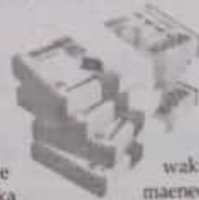
wakulima kupata maeneo kwa ajili ya kilimo ili kujikwamua