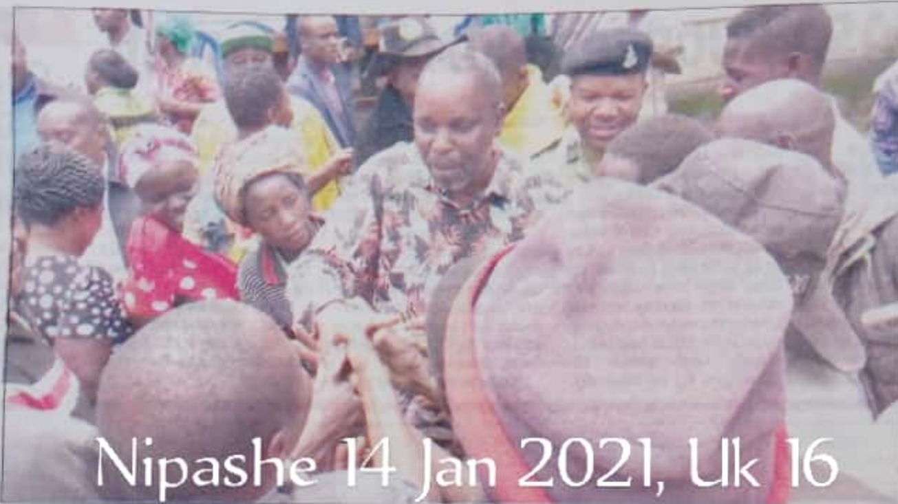
Waziri wa Mifugo na Uvuvi, Mashimba Ndaki, akisalimiana na baadhi ya wakulima na wafugaji wanaofanya shughuli zao kwenye Ranchi ya Usangu ili-yopo Wilaya ya Mbarali, mkoani Mbeya jana.