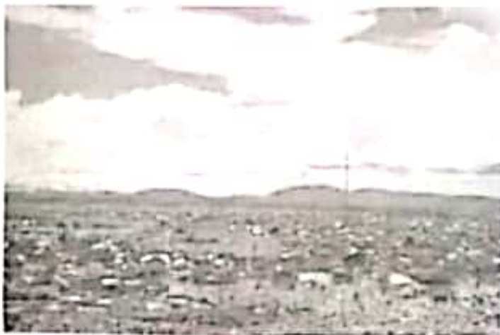
Eneo la ardhiwevu ya Ihefu.

hicho Manyara mataala na wanakijiji wenzake walitua madai hayo walipokutana na waandishi wa habari za mazingira waliofika kijiji hapo wakawa katika mara yao ya kikazi kufuatilia masuala ya uwindaji ufugaji na migojoto ya ardhi.