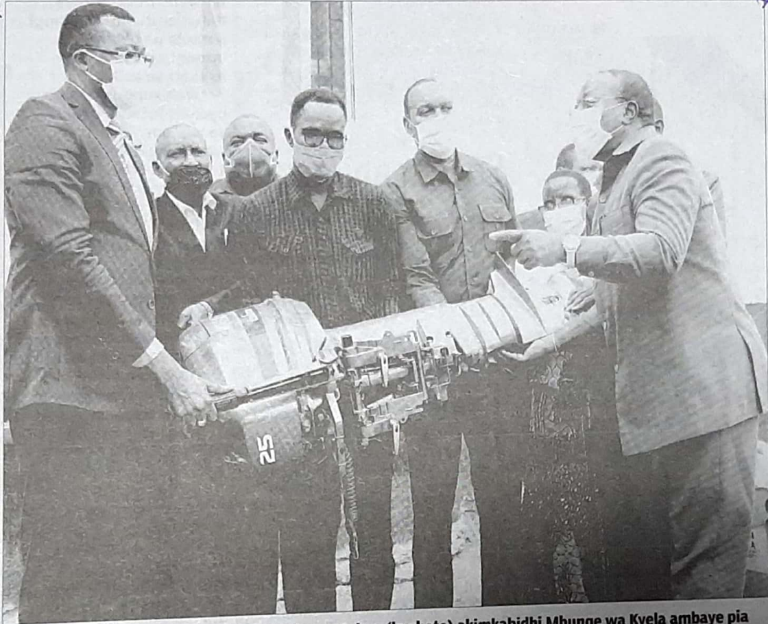
MSAADA: Waziri wa Mifugo na Uvuvi, Luhaga Mpina (kushoto) akimkabidhi Mbunge wa Kyela ambaye pia ni Waziri wa Habari, Utamaduni, Sanaa na Michezo, Dk. Harrison Mwakyembe injini ya boti iliyotolewa na Serikali kwa kikundi cha wavuvi cha Kyela mkoani Mbeya wakati wa hafla ya makabidhiano ya injini hiyo Dodoma jana.