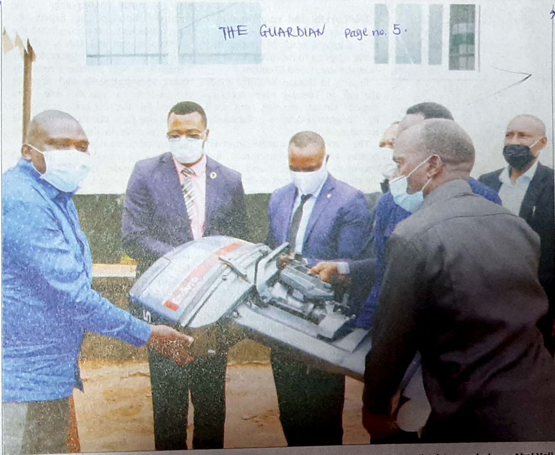
Livestock and Fisheries minister Luhaga Mpina (2nd-L) presents to Kaliua (Tabora Region) district commissioner Abel Yeji Busalama a speed boat engine the government has donated to a group of fishermen based in the district. This was at a ceremony held in Dodoma city.